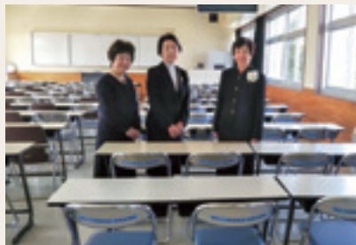
会長・副会長によるいすの贈呈

令和元年度は、創立百十五周年でもありました。これを記念しまして、キャスター付きテレビを各階に一台ずつ計四台、ブルーレイ再生機一台、視聴覚室のパイプイス二十脚を同窓会よりご寄付いただきました。